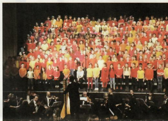
Der Schülerchor mit Orchester im National in Bern.

Weitere Impressionen: www.schule-muri.ch oder www.singmituns.ch